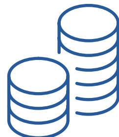
Répartition des dossiers par mesure